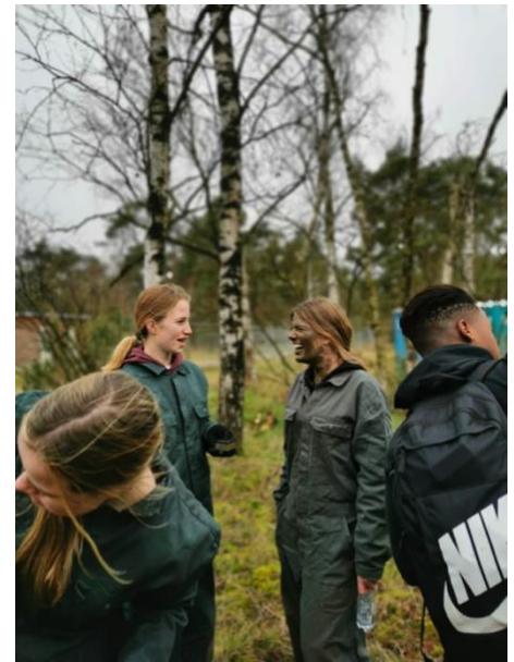
Illustratie 2: Camoufleren kun je leren

Beste groepsleerkracht: geef niet alleen een advies over het niveau, maar vertel je potentiële vmbo-leerlingen ook over het profiel D&P en de kansen en mogelijkheden die dit profiel biedt voor de toekomst van jouw leerlingen. D&P, ALTIJD DE JUISTE KEUZE!