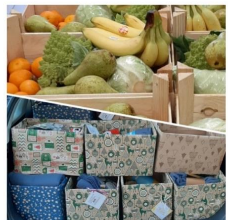
Illustratie 3: Kerstpakketten voor de wijk